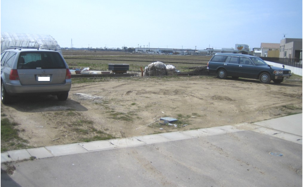
《 現地写真 》