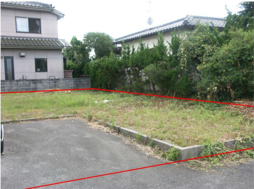
< 写真 >