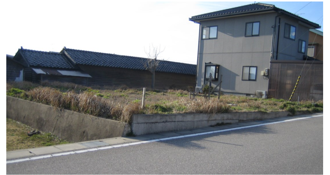
《 現地写真 》